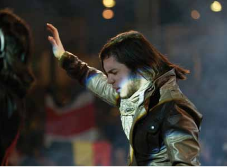
Bilder, die von der Sehnsucht nach mehr von ihm erzählen ...