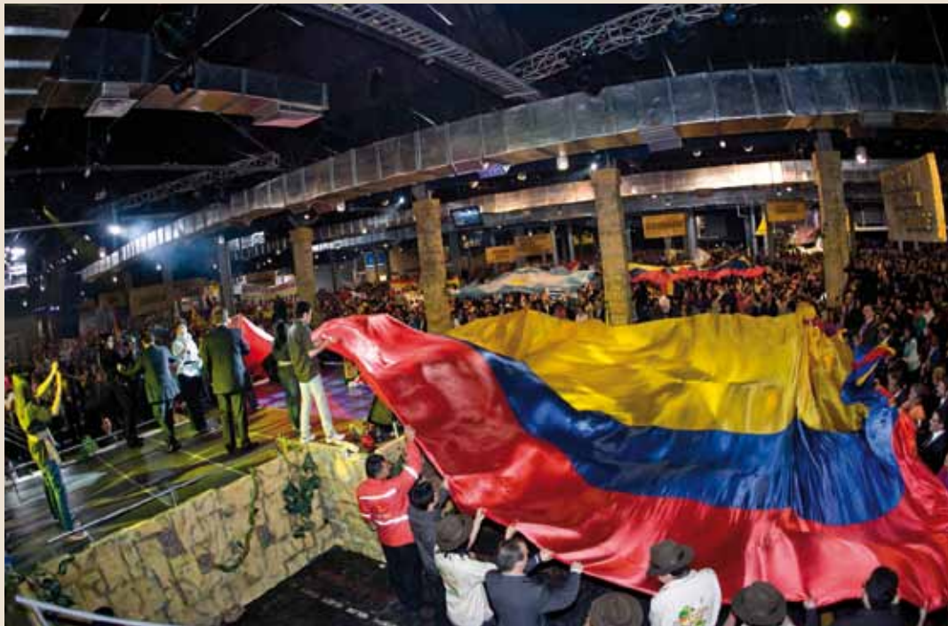
Centro Mundial de Avivamiento: Gebet für Kolumbien

Gemeindebau in der Kraft des Heiligen Geistes