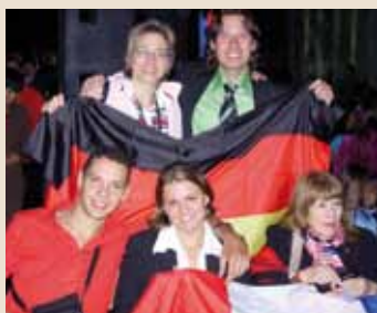
Segen für Frankreich und Deutschland