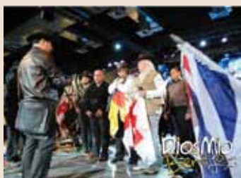
Gebet für Europa

Die Gemeinde Centro Mundial de Avivamiento in Bogotá, Kolumbien, erlebt seit einigen Jahren eine erstaunliche Zunahme der spürbaren Gegenwart Gottes, die sich unter anderem in Heilungen sowie „Zeichen und Wundern“ ausdrückt. Die Zahl der Gottesdienstbesucher steigt beständig, sodass die Versammlungsräume – trotz ständiger Vergrößerung – bald schon wieder zu klein sind. Derzeit finden am Wochenende drei Gottesdienste mit jeweils etwa 20.000 Besuchern statt.